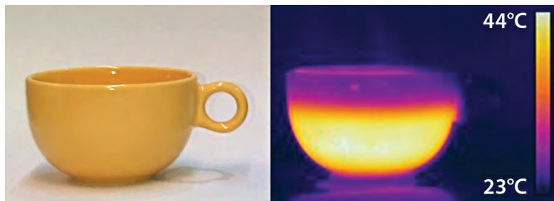
Une tasse de café chaud en lumière visible et sous l'oeil de la caméra infrarouge est présentée (p. 26) au cours de notre expo "Sciensations ! Nos sens en sciences"