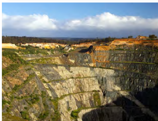
Gisement de lithium-tantale de Greenbushes (Aus), p. 61.